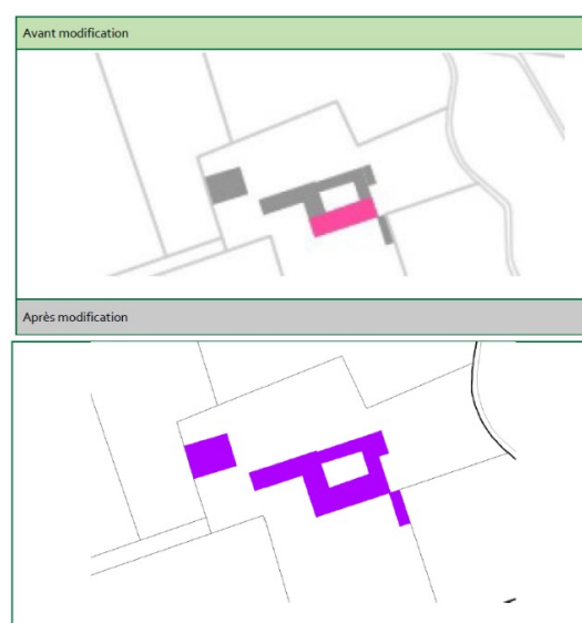
Figure 3: Localisation des bâtiments agricoles du domaine de Palerme pouvant changer de destination : identification avant et après la modification