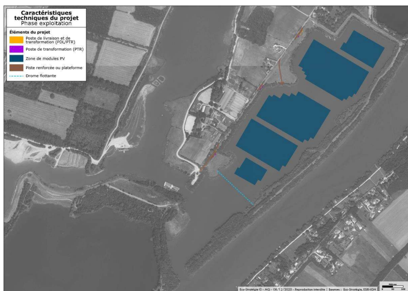
Figure 2: Plan d'implantation du projet (source : étude d'impact)

Deux plateformes temporaires de mises à l'eau et des pistes impliqueront 0,61 ha d'artificialisation. Une base de vie de 0,15 ha et une aire de stockage gravillonnée de 2 ha s'ajouteront aux surfaces considérées dans le dossier comme temporairement artificialisées, pour un total de 2,76 ha. Les pistes d'accès à la zone de mise à l'eau à l'ouest représentent 165 m linéaires, pour une surface de 1 279 m 2 et celles pour l'accès aux postes 855 m 2 . Les autres voies d'accès et de desserte se feront au moyen des chemins existants, ce qui donnera accès au site sans nécessiter l'aménagement de nouvelles voies. Le dossier retient une artificialisation « finale » de 164 m 2 correspondant aux postes, complètement étanches, les pistes et zones de mises à l'eau (0,29 ha) étant perméables.