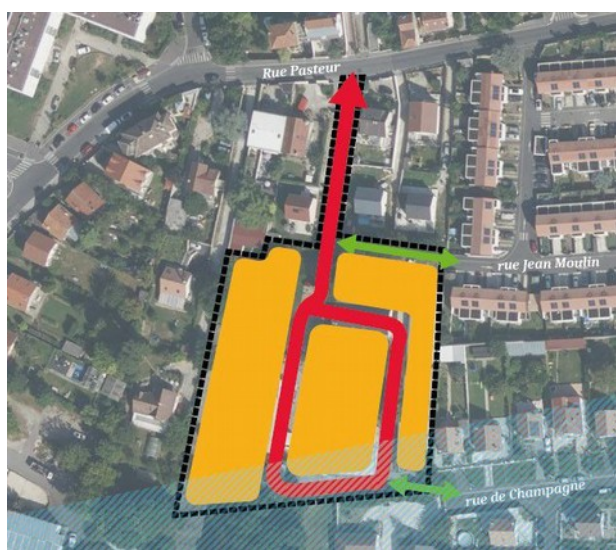
Figure 1: Schéma de l'OAP

Considérant que le secteur de l'OAP projetée au 26 rue Pasteur est particulièrement affecté par une pollution sonore qui, selon la carte de BruitParif (ci-dessous reproduite) est évaluée dans la journée à 60-65 dB(A) ; que ce niveau sonore est bien supérieur aux valeurs-guides au-delà desquelles l'Organisation mondiale de la santé considère que cette pollution porte atteinte à la santé des populations (53 dB pour les routes, 45 dB pour les avions) même si le dossier précise qu'aucune habitation ne sera implantée dans le périmètre de la zone C du plan d'exposition au bruit aéroportuaire et que le nombre de logements sera limité à 15 maisons individuelles ;