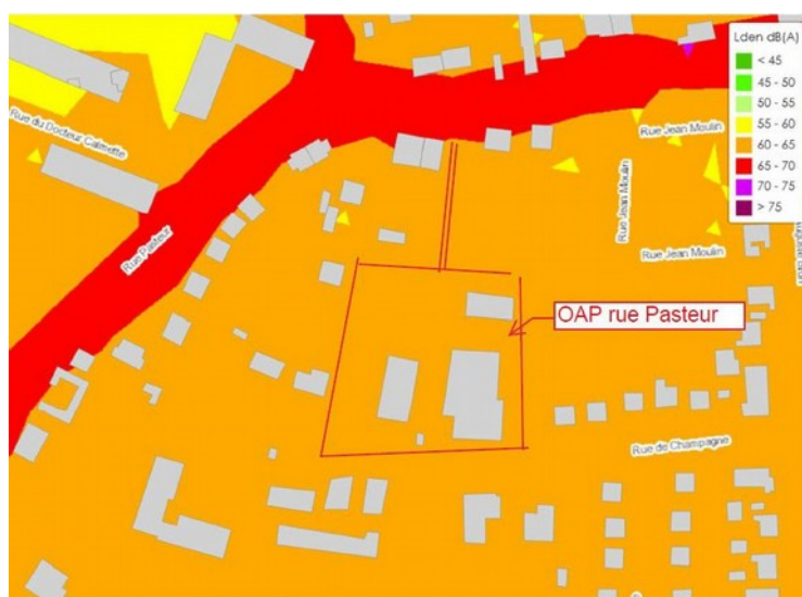
Figure 2: Contours approximatifs du secteur de l'OAP du 26 rue Pasteur reportés sur la carte de BruitParif

Considérant les évolutions de la modification n° 2 du plan local d'urbanisme de Limeil-Brévannes depuis l'avis du 13 septembre 2023 :