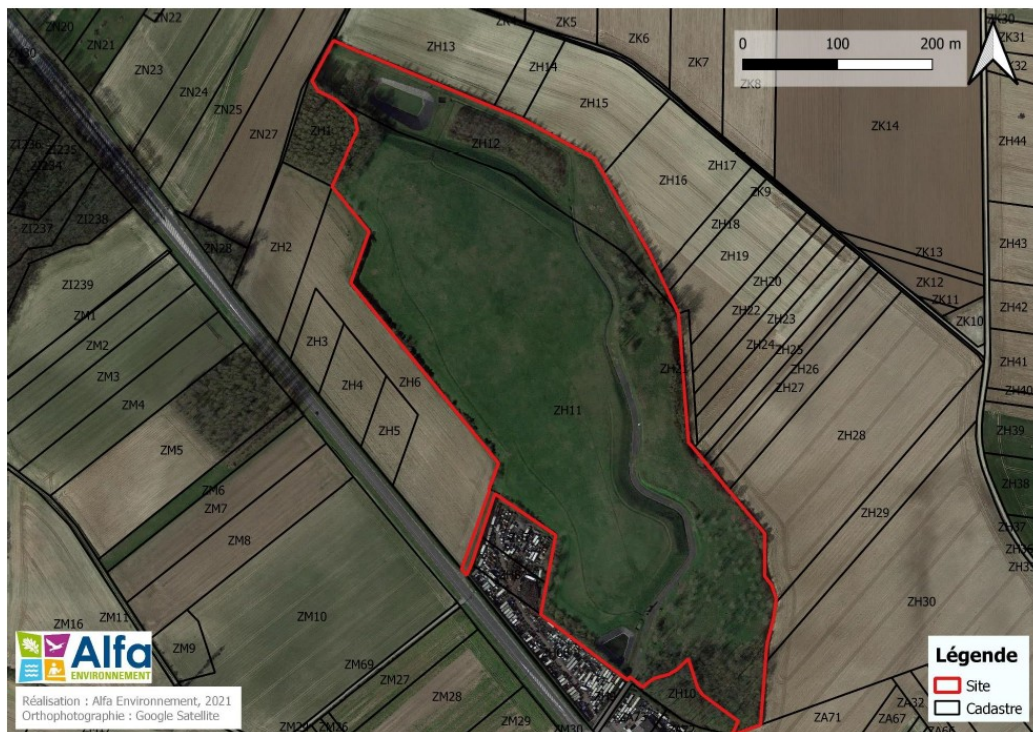
périmètre du site (diagnostic écologique page 7 de la version numérique)