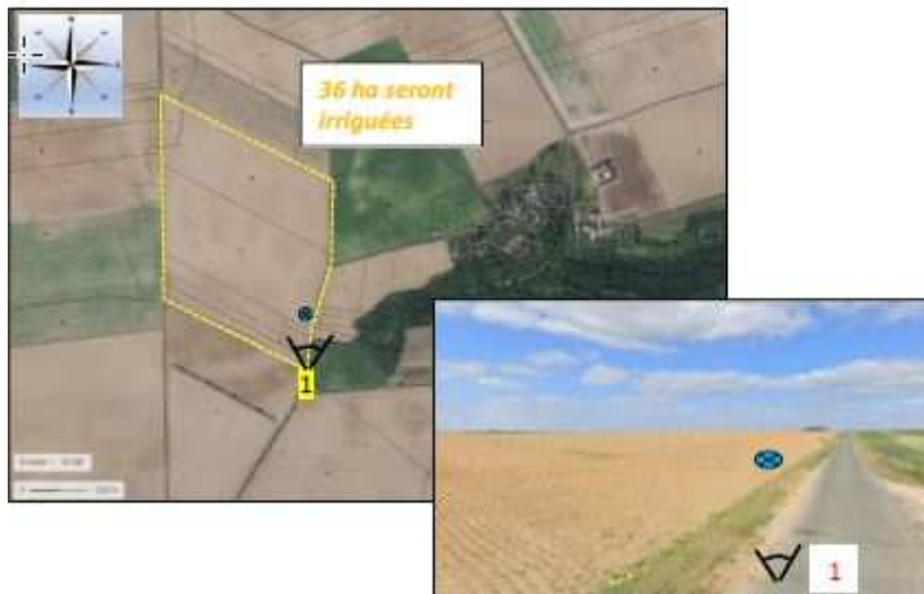
Localisation du projet

Le projet de forage a été soumis à étude d'impact par décision n°2022-6085 1 du 17 mai 2022, après examen au cas par cas sur la base des motivations suivantes :