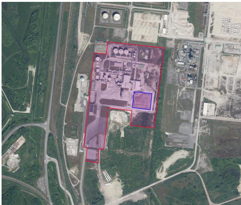
Vue aérienne du site Hydrométal France