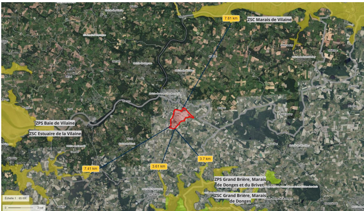
Situation du site de projet vis-à-vis des sites Natura 2000

En raison de la distance entretenue entre le site de projet et les espaces d'importance particulière pour l'environnement (Natura 2000, ZNIEFF), le présent objet est sans incidence notable sur les zones revêtant d'une importance particulière pour l'environnement.