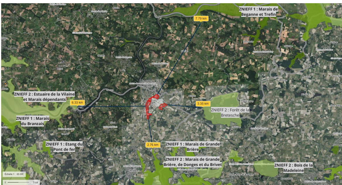
Situation du site de projet vis-à-vis des ZNIEFF.