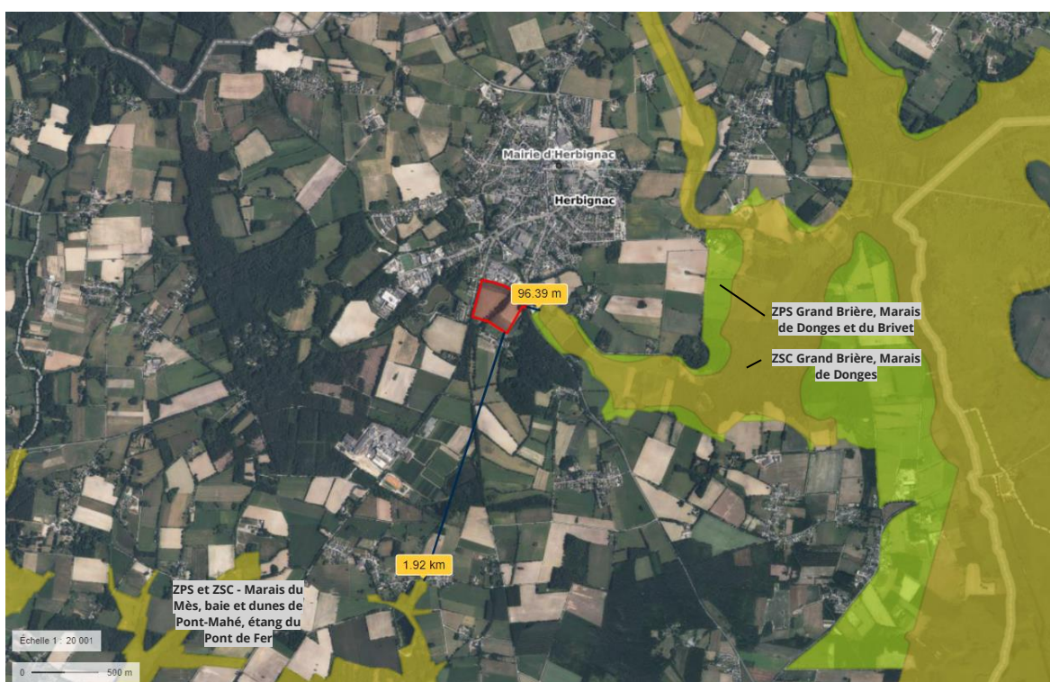
Situation du site de projet vis-à-vis des sites Natura 2000.

Ces sites Natura 2000 sont séparés du site de projet par la RD47, bordant l'Ouest du site de projet et l'Est des sites Natura 2000, en marquant d'ailleurs la limite.