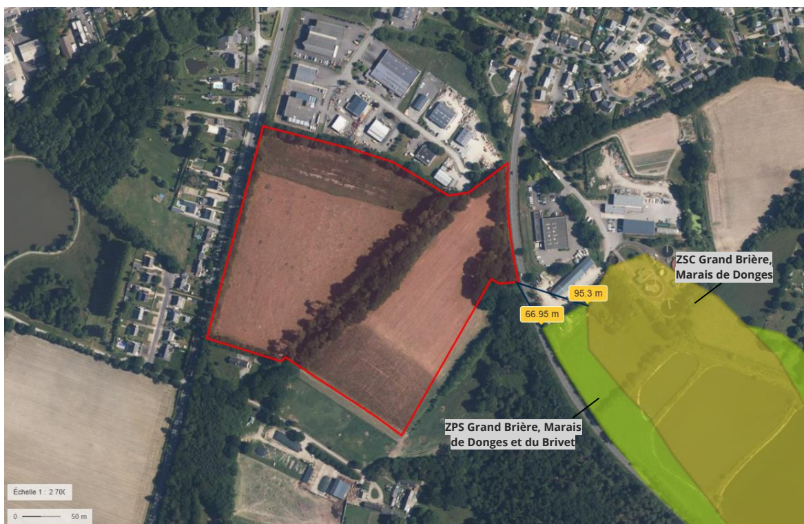
Zoom sur les sites Natura 2000 à proximité.

Le site de projet est majoritairement à usage prairial, étant identifié au RPG 2021 en tant que « Autre prairie temporaire de 5 ans ou moins » à l'Ouest de la triple haie, et « Autre fourrage annuel d'un autre genre » à l'Est de la triple haie.