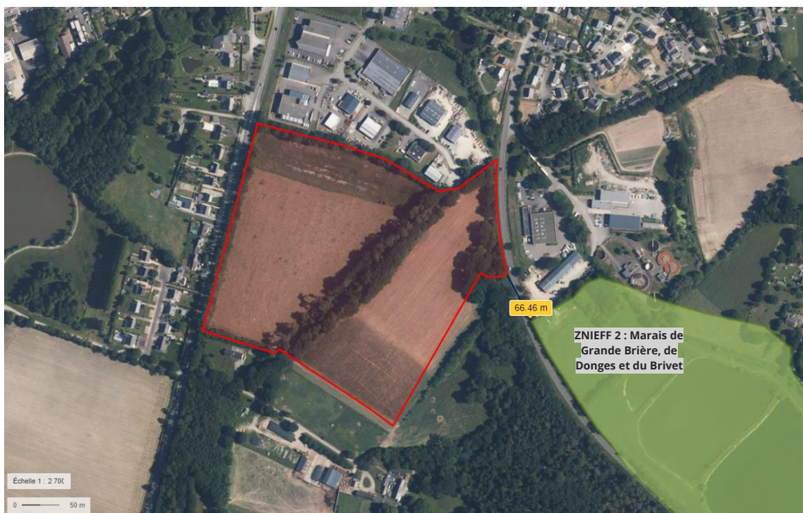
Zoom sur les ZNIEFF à proximité.