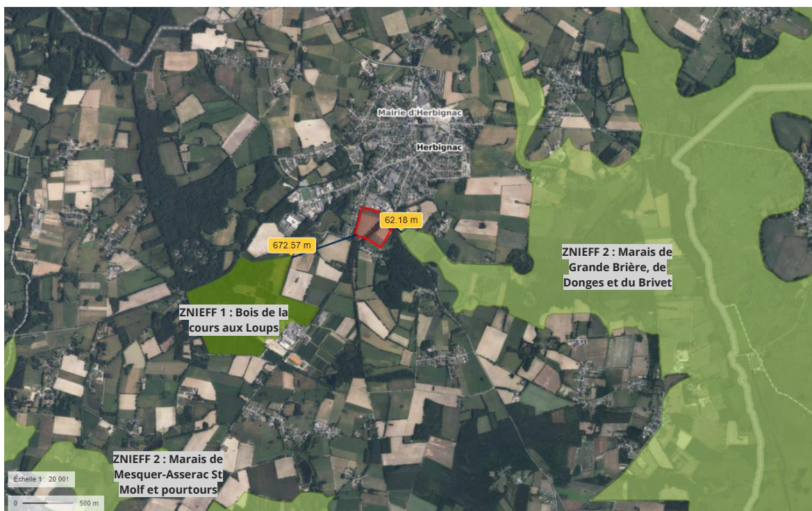
Situation du site de projet vis-à-vis des ZNIEFF.