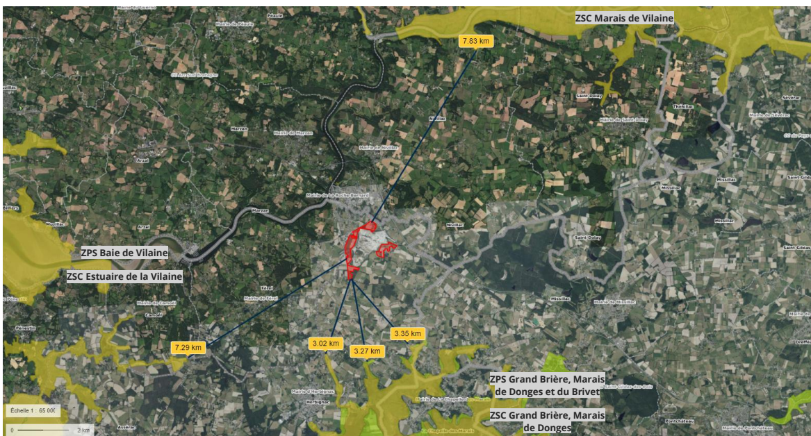
Situation du site de projet vis-à-vis des sites Natura 2000.

En tout état de cause, la nature de l'objet cité ci-dessus n'a pas vocation à avoir d'incidence notable sur les zones revêtant une importance particulière pour l'environnement.