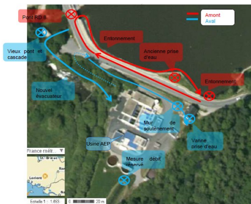
Description des éléments du barrage

Les travaux sont planifiés entre avril et octobre 2021.