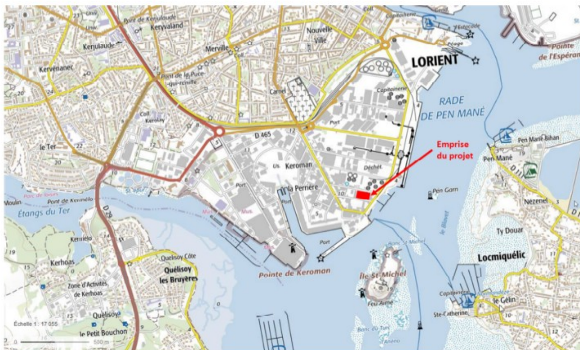
Localisation du projet

Ce projet a notamment pour objectif de contribuer à l'amélioration de la qualité des eaux de la rade de Lorient, à la préservation du prélèvement d'eau de mer utilisée par la criée de Keroman, et à la réhabilitation des réseaux de collecte des eaux usées et des eaux pluviales du port de Keroman.