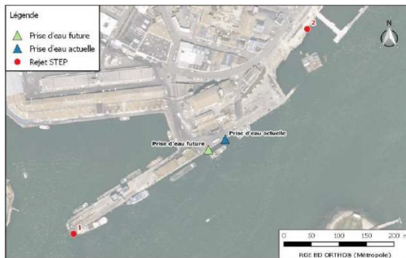
Localisation de la prise d'eau et des points de rejet en rade étudiés (source : étude d'impact)