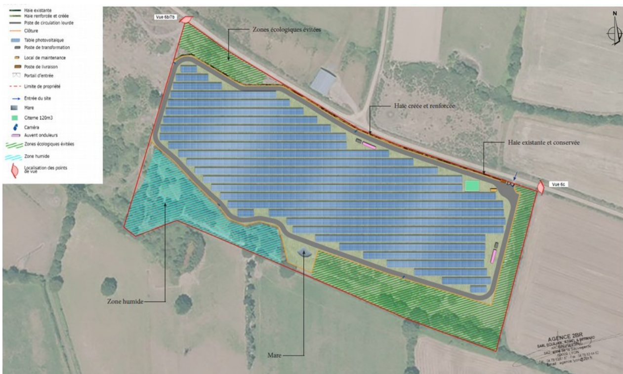
Illustration 3 : Schéma d'implantation de la centrale

Le terrain d'implantation nécessitera un nivellement, principalement au niveau des buttes constituant l'ancien parcours de moto-cross.