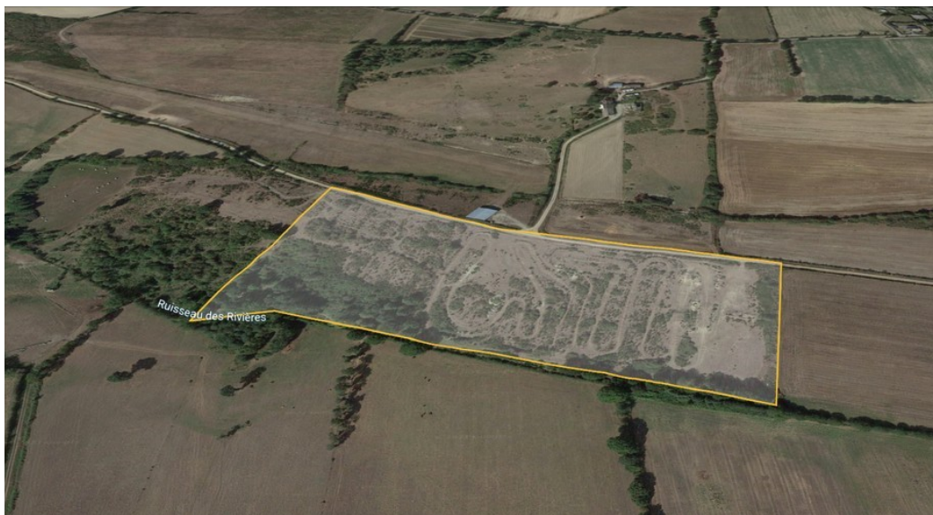
Illustration 2 : Site de projet

L'énergie produite sera transportée par des câbles enterrés vers les 2 postes de transformation électrique, eux-mêmes reliés au poste de livraison en entrée de site. Le raccordement est suspendu à l'obtention du permis de construire. Les informations à disposition permettent d'avancer l'hypothèse d'un raccordement au poste-source de Derval, à 13 km au sud du site.