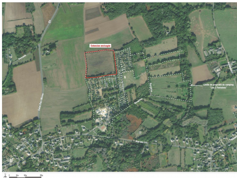
Illustration 1: Vue aérienne du camping des deux fontaines et du secteur d'extension

Le projet d'extension du camping concerne la mise en place de 60 mobil-homes avec terrasse, de 40 emplacements nus équipés de points d'eau et d'électricité, ainsi que la création d'une voirie principale périphérique, de 65 places de parking et d'un réseau de voiries secondaires pour relier les hébergements entre eux. Ce projet d'extension constitue une artificialisation et un changement d'usage des sols.