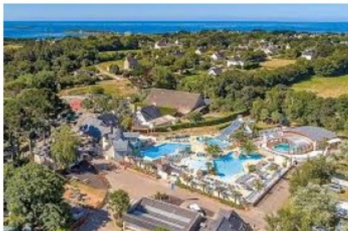
Vue panoramique de l'installation actuelle ; Photo © Eurocampings.

Le projet d'extension du camping concerne la mise en place de 60 mobil-home avec terrasse et de 40 emplacements nus équipés de points d'arrivée d'eau et d'électricité, sur une parcelle de 2,6 ha 2 , située au nord de l'emprise actuelle ainsi que la création d'un dispositif d'assainissement à l'est du camping sur une parcelle d'environ 7 200 m 2 . Le camping des deux fontaines comprendra après extension une capacité d'accueil de 295 hébergements et de 98 emplacements nus.