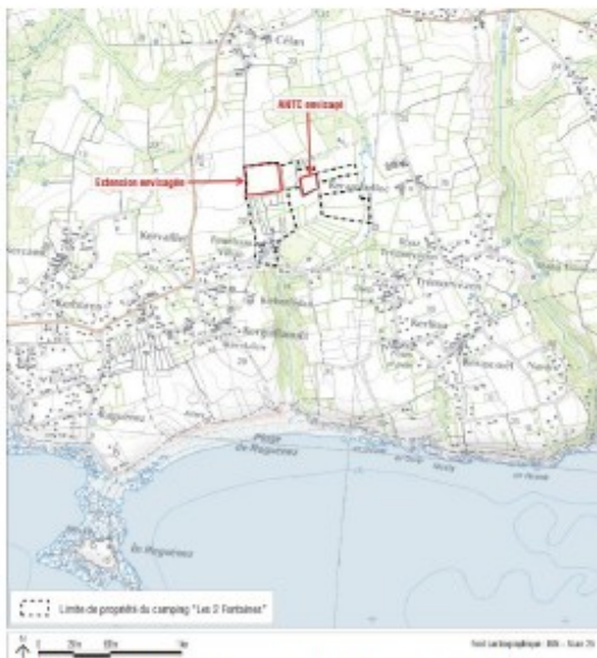
Localisation du camping des 2 fontaines et de son projet d'extension.

Il s'agit d'un équipement touristique de style « international » tel qu'on peut en trouver le long de nombreux littoraux sur plusieurs continents ; il produit, dès qu'on y pénètre, un contraste avec le paysage bocager typique de la Cornouaille et avec les constructions à mur pignon et toits d'ardoise qui le ponctuent.