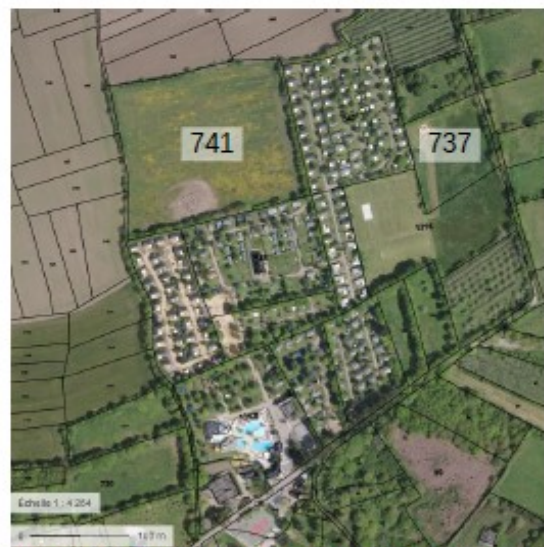
Photographie aérienne et cadastre du secteur projet.

Avis délibéré n° 2020-008415 adopté lors de la séance du 17 décembre 2020