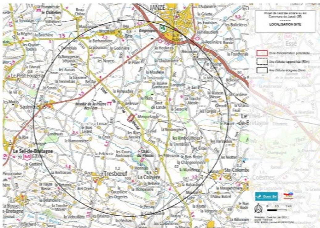
Illustration 1 : Localisation du site du projet

La zone d'implantation potentielle de la centrale solaire photovoltaïque (en rouge sur l'illustration ci-dessus) se trouve à proximité du Lieu-dit Montlouis, à environ 5 km au sud du bourg de Janzé. Elle se situe à 180 m au nord-est et au sud-est des premières maisons. Le terrain prévu pour accueillir le projet se situe au sud d'une carrière en exploitation. Il appartenait à l'exploitant et correspondait à une zone d'extraction, de stockage et de transit des granulats. Dans le cadre de la remise en état en 2011 de ce terrain, celui-ci a fait l'objet d'un aménagement en prairie après un remblaiement réalisé à l'aide de matériaux inertes.