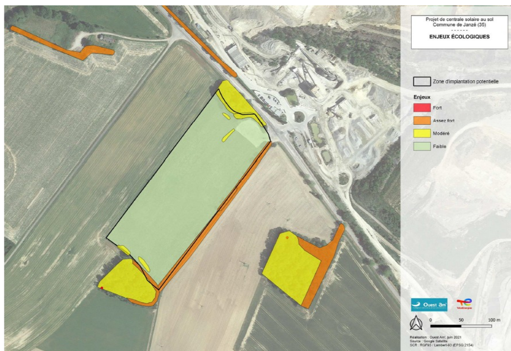
Illustration 4 : Synthèse des enjeux écologiques

La caractérisation des enjeux naturalistes est satisfaisante. Elle a été réalisée sur la zone d'implantation du projet et dans un rayon d'environ 50 m autour de celui-ci, avec un périmètre plus étendu pour la faune volante afin de prendre en compte ses déplacements. Les campagnes d'inventaires faune et flore ont été conduites de février à septembre 2020.