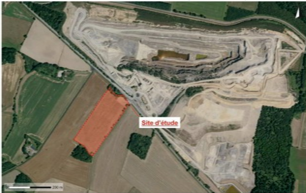
Illustration 2 : Site de projet (source dossier)

L'énergie produite sera transportée par des câbles enterrés vers les 2 postes de transformation électrique, eux-mêmes reliés au poste de livraison en entrée de site. Le raccordement est conditionné à l'obtention du permis de construire. Les informations à disposition permettent d'avancer l'hypothèse d'un raccordement (par câbles enterrés) au poste de distribution public situé à 115 m du site, lui-même relié au poste-source de Le Pas, à 4,6 km au sud-est .