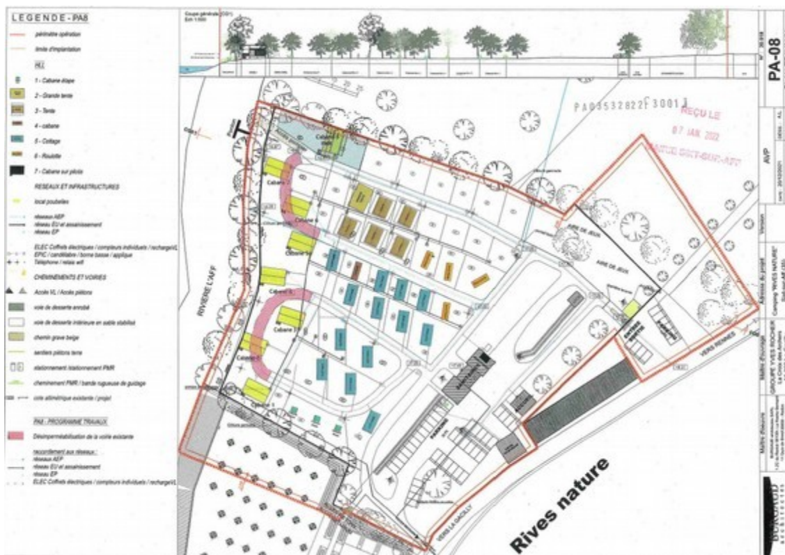
Illustration 2: plan de composition de l'aménagement. Les 8 cabanes sur pilotis à implanter sont matérialisées en jaune à l'ouest du camping, dont celle, au nord-ouest, maintenue en zone humide (délimitation de cette zone en gris-bleu). En rose, à l'ouest, la suppression d'une partie de la voirie interne, qui sera désimpermeabilisée.

Le camping est relié au réseau d'assainissement des eaux usées de La Gacilly, ainsi qu'au réseau public d'eau et d'électricité.