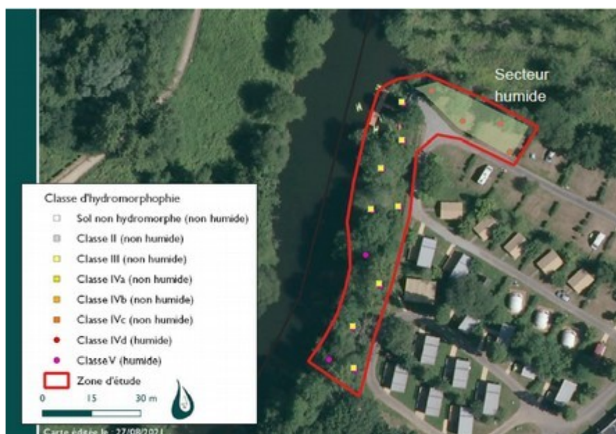
Illustration 4: cartographie de l'inventaire des zones humides réalisé sur le camping par DM'Eau

La zone humide, inventoriée par le schéma de gestion et d'aménagement des eaux de la Vilaine en 2016, a fait l'objet d'une délimitation plus précise grâce à des sondages pédologiques réalisés dans le cadre du présent projet (illustration 4). Elle concerne des emplacements libres du camping sur remblais, et certains endroits en berge de l'Aff.