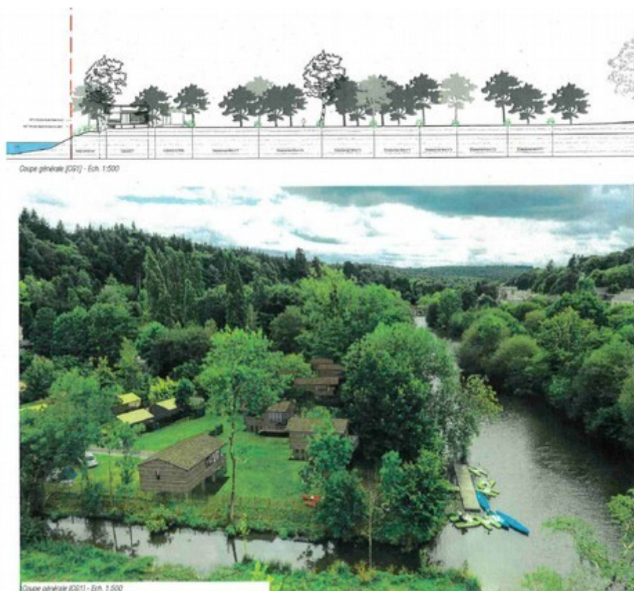
Illustration 5: Simulation paysagère du futur projet en vue nord