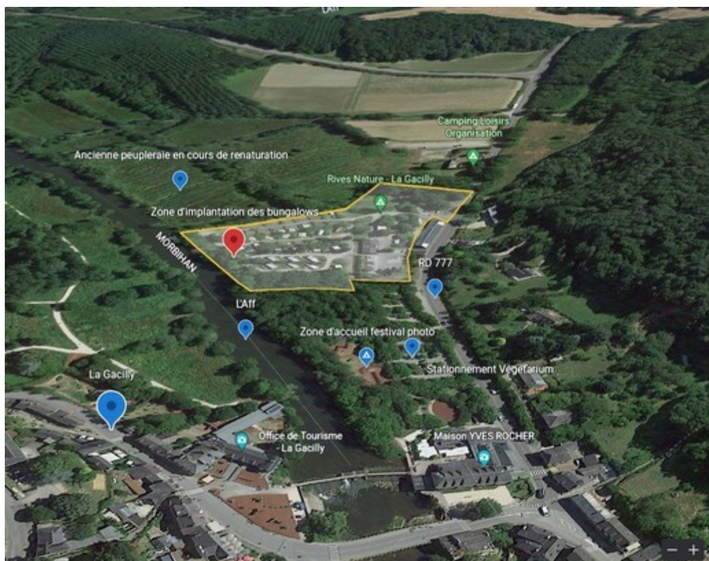
Illustration 3: Vue aérienne du périmètre du projet