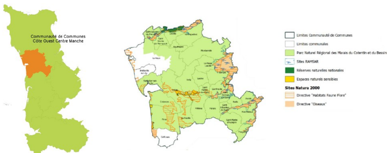
Figure 1 : Localisation et carte des principaux espaces naturels de la communauté de communes COCM (p. 19 et 30 du « diagnostic »)

Selon le dossier, qui s'appuie sur les données de l'Insee de 2015, 75 % des emplois sont concentrés sur les principales communes du territoire. Le secteur du commerce, du transport et des services est prédominant avec 31,8 % des emplois, suivi par l'industrie (transformation de produits agro-alimentaires, carrières...) avec 18,2 % des emplois puis l'agriculture avec 15,5 % des emplois (contre 6,7 % pour le département de la Manche et 3,7 % au niveau national).