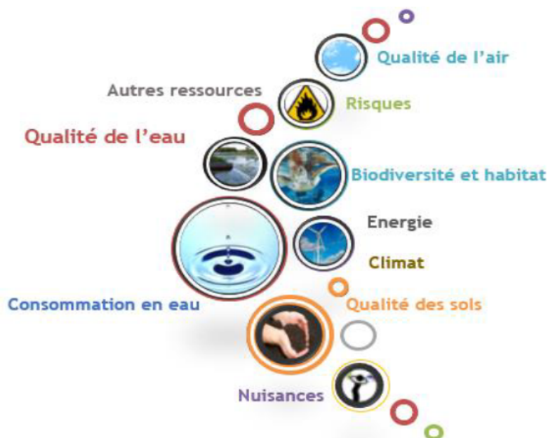
Figure 4 : Domaines environnementaux étudiés

L'état initial de l'environnement s'appuie sur une approche « par compartiment », ce qui semble pertinent pour la qualité de l'analyse. Ainsi 10 domaines environnementaux sont proposés: qualité de l'air, qualité des eaux, qualité des sols, la ressource en eau et consommation, énergie, autres ressources (bois, minéraux, métaux non ferreux...), biodiversité et habitat, climat, risques et nuisances.