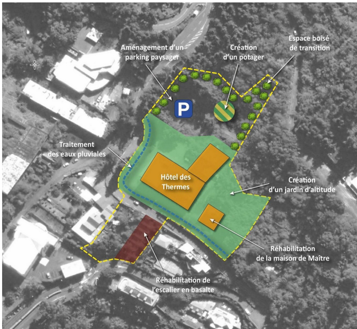
Schéma de l'OAP du projet de réhabilitation de l'hôtel des Thermes (extrait du rapport de modification du PLU)

La modification du PLU introduit la création d'une Orientation d'aménagement et de programmation (OAP) spécifique au secteur de l'hôtel des Thermes. Cette dernière précise les attendus en matière d'aménagement et de valorisation du site.