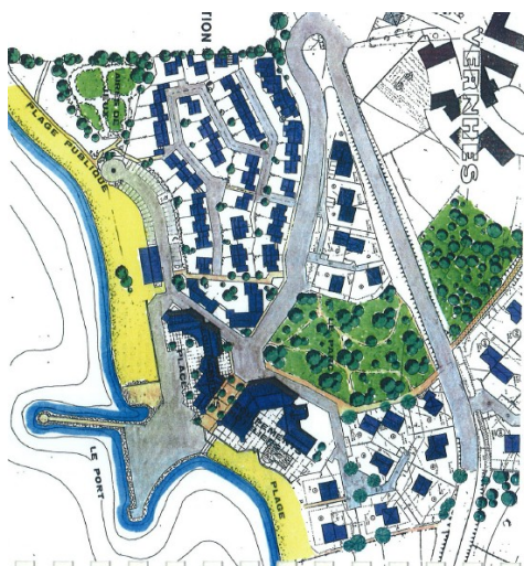
Plan de composition de la phase 1 de l'UTN

S'agissant des aménagements prévus sur le hameau « Les-Vernhes », établis conformément à l'unité touristique nouvelle (UTN) en vigueur selon le rapport (p. 284), la MRAe constate que la coupure verte prévue sur la phase 1 de l'UTN n'est pas maintenue dans le plan de zonage, qui permet l'urbanisation intégrale de la zone.