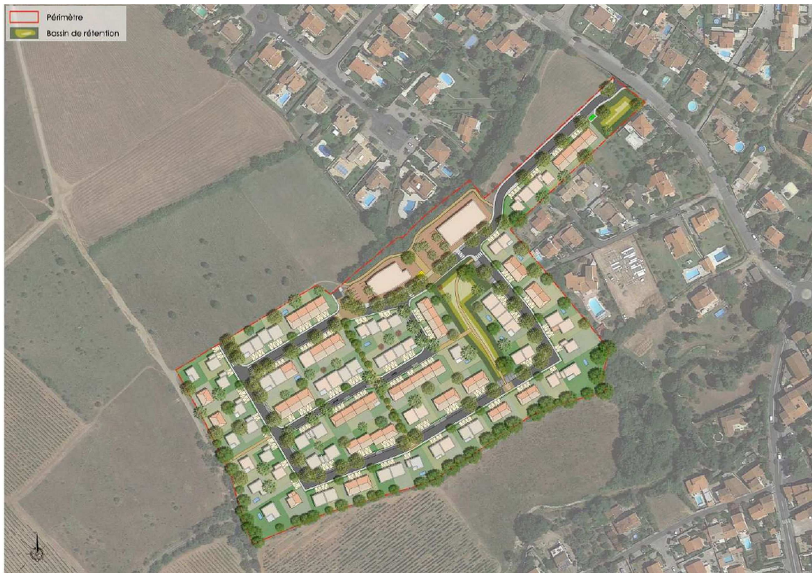
Figure 2 : plan d'hypothèse d'implantation du projet (extrait de la page 7 de l'étude d'impact)