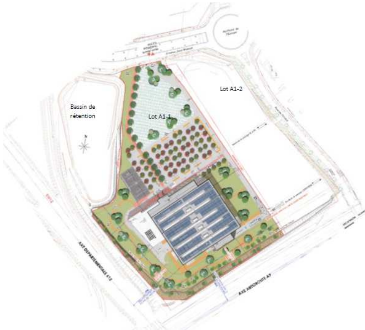
Figure 2 : plan d'aménagement retenu (extrait de la page 9 de l'étude d'impact)

Compte-tenu du fait que le projet prévoyait la création de plus de 100 places de stationnement à la date de dépôt du permis de construire, l'opération était soumise réglementairement à une demande d'examen au cas par cas 2 .