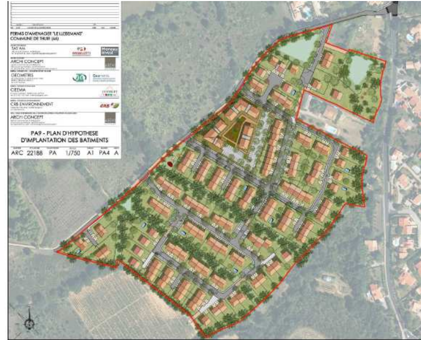
Figure 2 : plan d'hypothèse d'implantation des bâtiments (extrait de la page 8 de l'étude d'impact)