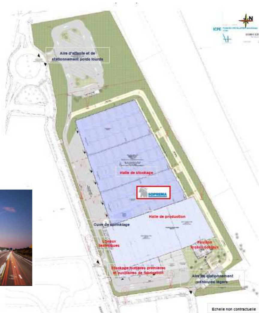
Figure 2: composition du projet