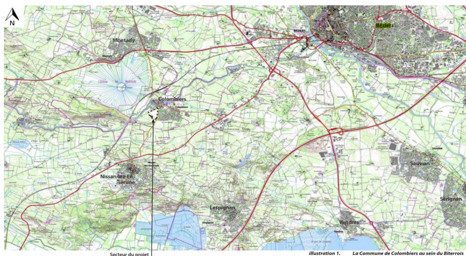
Carte de localisation de la commune et du projet dans le Biterrois, issue du rapport de présentation

Le territoire communal est couvert par le schéma de cohérence territorial (SCoT) du Biterrois approuvé en juin 2013, dont le projet de révision a donné lieu à un avis de la MRAe en date du 12 avril 2022 6 .