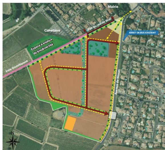
Schéma d'aménagement du secteur – projet d'orientations d'aménagement et de programmation