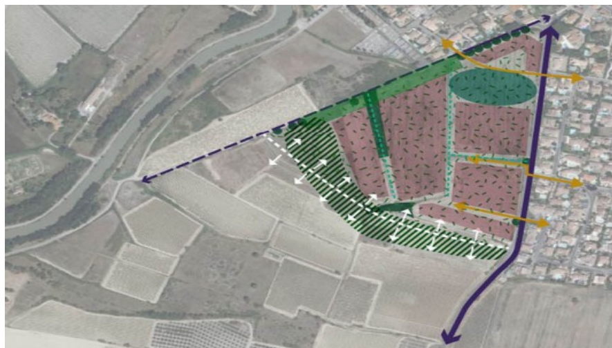
Carte des grands principes d'aménagement, issue de l'étude d'impact

L'état initial paysager identifie les points, les axes de vue et les covisibilités du projet. Les mesures proposées mettent l'accent sur l'aménagement végétal avec l'interface végétale avec le canal du Midi et la Voie Domitienne, la lisière plantée au sud et la composition végétale du projet, qui sera « particulièrement soignée... avec un choix d'espèces méditerranéennes ».