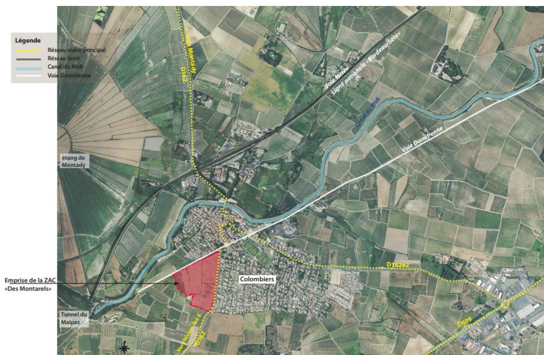
Carte de localisation du projet dans la commune, issue du dossier

Le projet de ZAC « Des Montarels » est situé en limite sud-ouest du centre urbain, sur des milieux ouverts, appartenant à l'unité paysagère « les collines viticoles du Biterrois et du Piscénois » selon l'atlas des paysages du Languedoc-Roussillon. Proche et partiellement visible du canal du Midi, le terrain longe une partie de la Voie Domitienne (« Via Domitia » 7 ) et côtoie aussi plusieurs sites remarquables, historiques et archéologiques. Le projet est totalement inclus dans le périmètre de l'opération Grand Site « Canal du Midi du Malpas à Fonsérane », en bordure du site classé du « Canal du Midi », partiellement inclus dans le site classé « Paysages du Canal du Midi » et à 500 m du site classé de l'ancien étang de Montady.