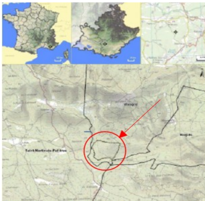
Figure 1: Localisation du secteur de projet

Au regard du PLU en vigueur, le projet s'inscrit donc en zone naturelle (N) qui n'autorise pas l'installation d'une centrale photovoltaïque au sol. Le zonage et le règlement du PLU sont actuellement incompatibles avec la réalisation du projet de centrale photovoltaïque au sol.