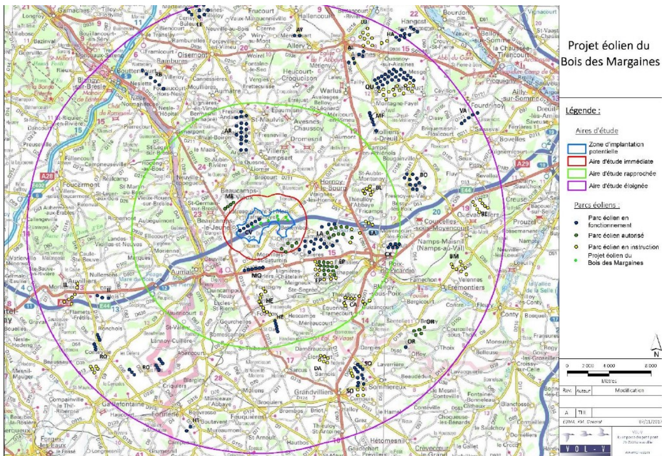
Contexte éolien au 22 novembre 2016

L'état du contexte éolien présenté (pages 257 et suivantes de l'étude d'impact) a évolué entre le dépôt du dossier initial et le retour des compléments. Des parcs répertoriés en travaux sont désormais construits.