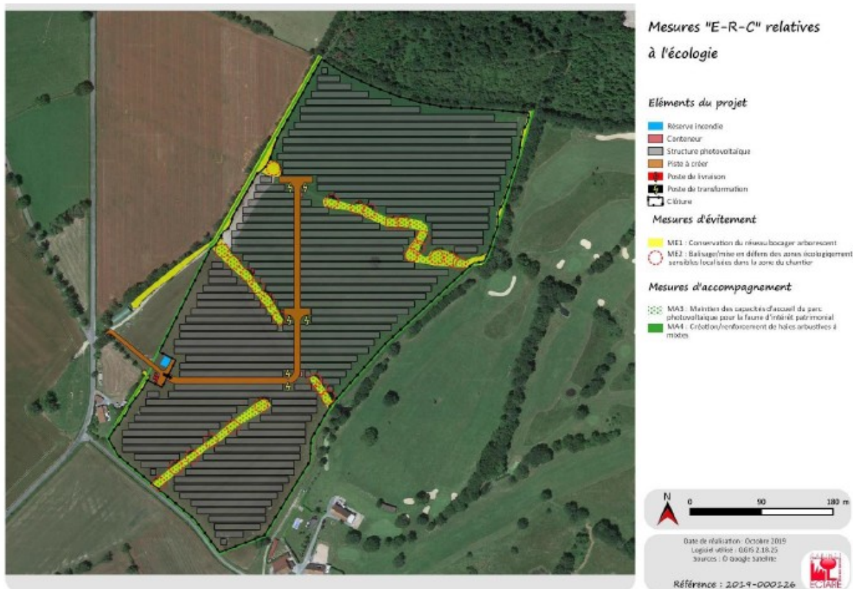
Cartographie des mesures retenues concernant le milieu nature

- Concernant le milieu humain et le paysage , après analyse des perceptions par secteur, il ressort de l'étude d'impact que les terrains du projet ne sont pas visibles depuis les secteurs éloignés compte tenu de la topographie et de la végétation sur le site et environnante.