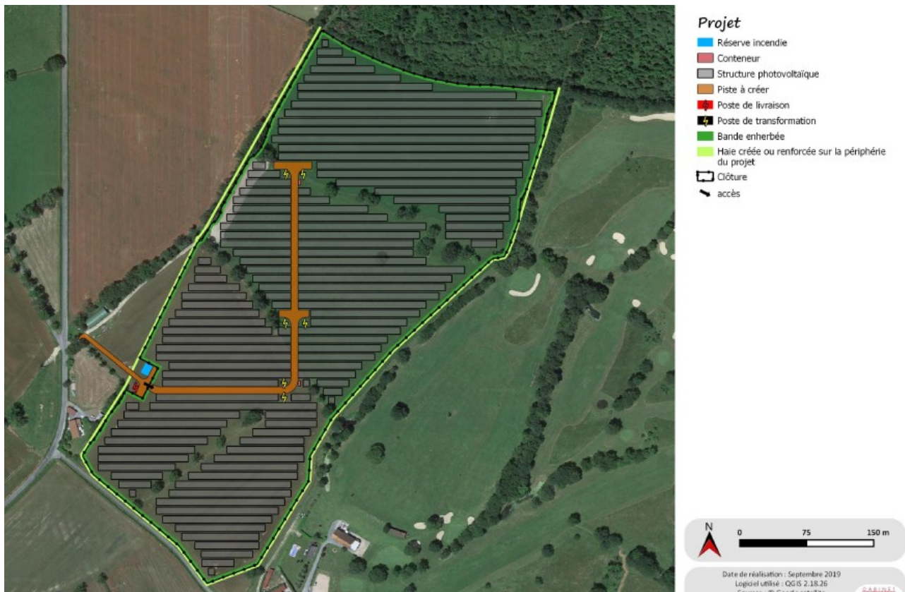
Plan masse du projet

De plus, l'étude d'impact indique que des éléments sont protégés au sein de l'aire d'étude immédiate (AEI), au titre du document d'urbanisme. Il s'agit des haies et d'un Espace Boisé Classé (EBC) qui se situe à l'ouest du site. L'étude d'impact précise que le boisement n'existe pas sur le terrain, mais que son emplacement est à préserver dans le cadre du projet (espace boisé à créer).