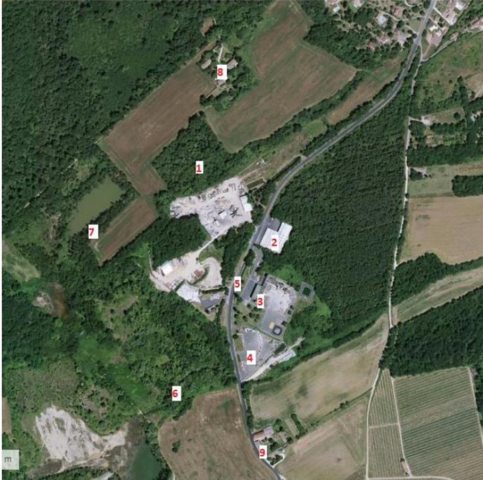
Carte 2 : Description du voisinage de l'établissement.