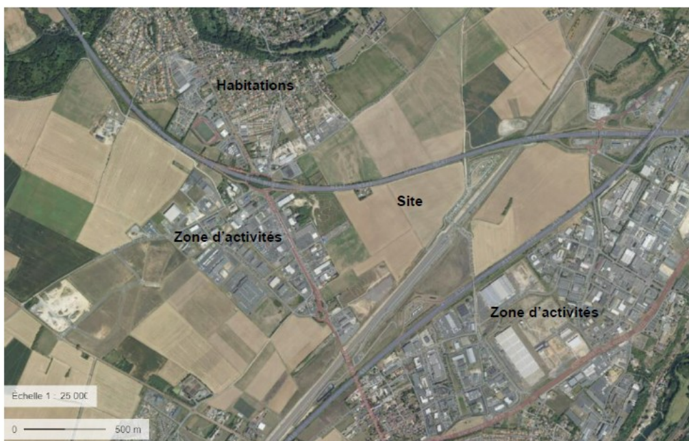
Environnement humain du projet (extrait de l'étude d'impact page 57)

Le terrain est encadré par plusieurs infrastructures routières : l'autoroute A10 Bordeaux-Paris au sud et à l'est, la RN 147 Limoges-Angers qui longe le terrain au nord et la RD 157 qui relie Poitiers à Migné-Auxances à l'ouest. Le projet se situe également à 60 mètres au nord-ouest de la LGV Sud Europe Atlantique.