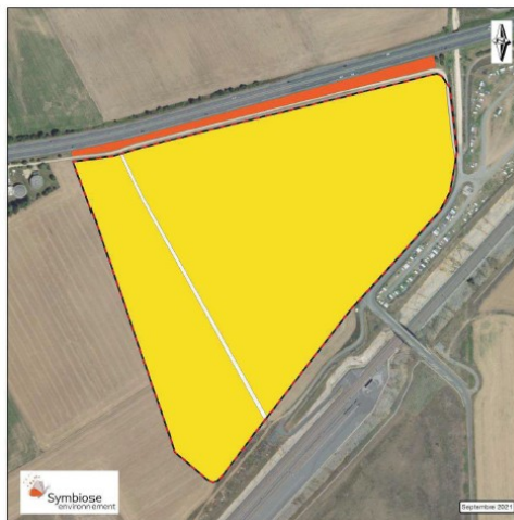
Synthèse des enjeux écologiques – extrait de l'annexe 4 page 79

Selon le dossier, les enjeux se concentrent sur la bande herbacée (prairie améliorée citée en 2012 comme prairie mésophile avec quelques éléments de pelouse calcicole) en bordure de la RN147.