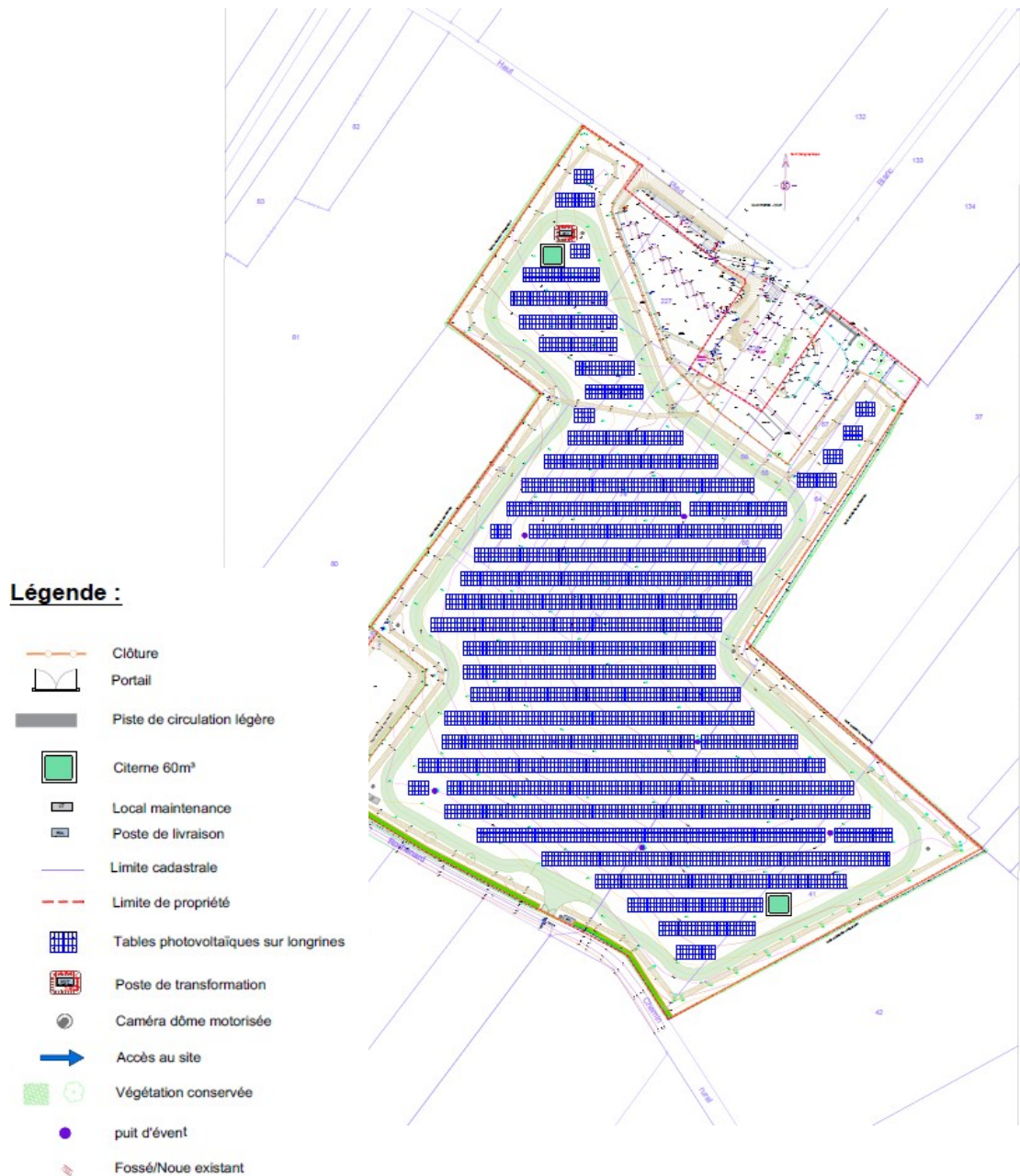
Plan masse du projet – extrait étude d'impact page 29

L'arrêt de l'activité a fait l'objet d'un arrêté préfectoral en date du 20 février 2004 prescrivant des mesures pour la fermeture et la réhabilitation du site, dont le réaménagement a été achevé en 2005.