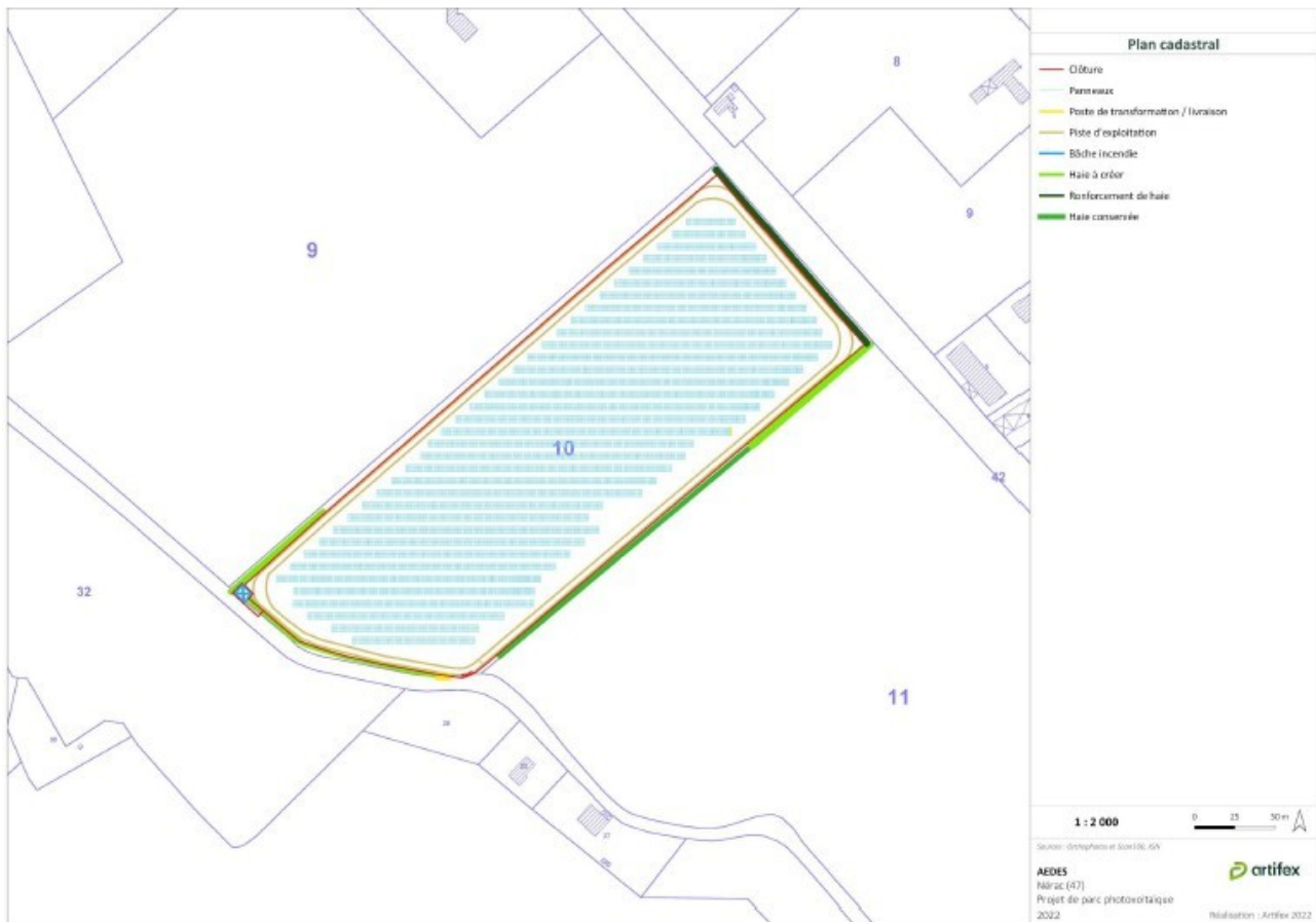
Plan masse du projet – extrait étude d'impact page 31

Le projet prévoit un raccordement électrique vers le poste source de Nérac, situé à environ 650 m du projet, et en privilégiant un raccordement souterrain le long des voiries (cf tracé en page 42 de l'étude d'impact).