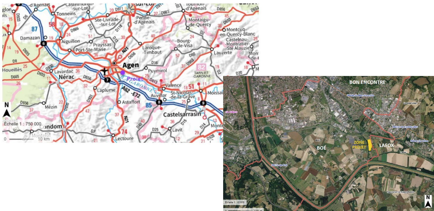
Plan de situation – extrait étude d'impact page 19

Le remblaiement de la carrière a débuté en 1995 avec des terres et des matériaux issus principalement de chantiers de terrassement et de démolition.