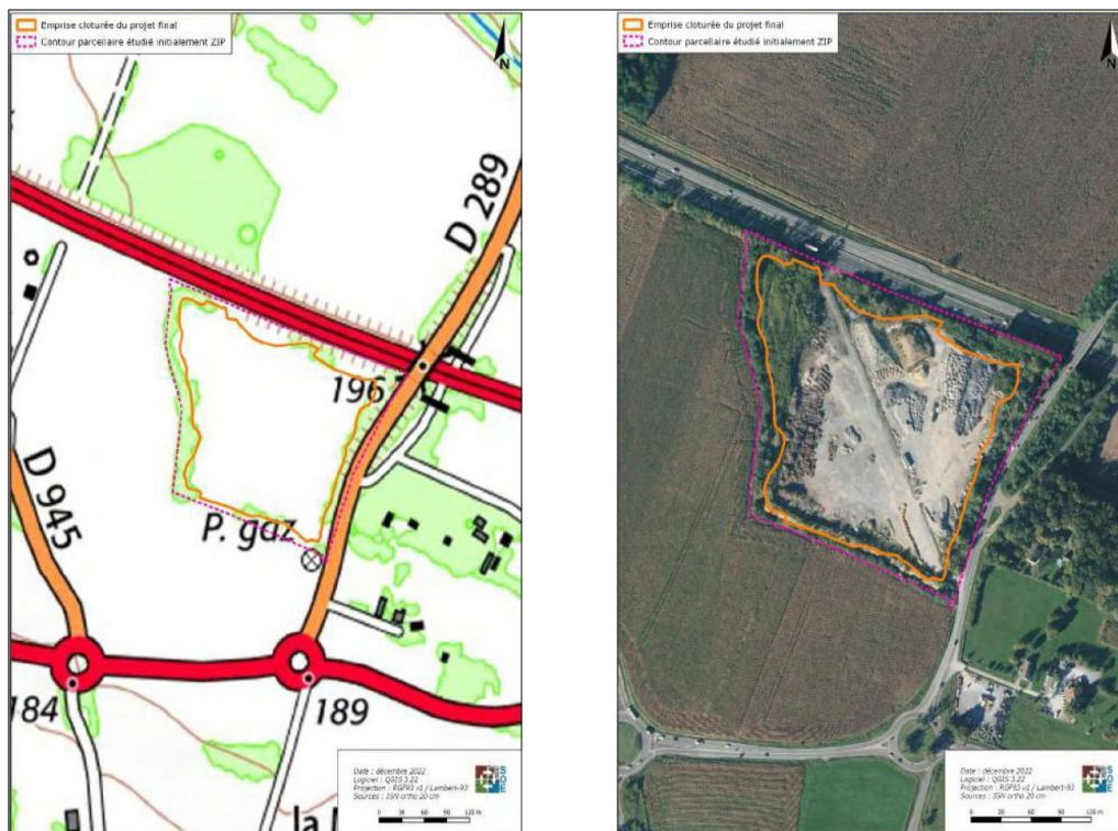
Plan de situation et vue aérienne du site d'implantation - extrait étude d'impact page 27

Le parc d'une surface clôturée voisine de 4,67 ha s'implante à proximité immédiate de l'A64, sur un délaissé autoroutier anciennement utilisé comme espace de stockage de matériaux. Il développe une puissance estimée d'environ 5,77 MWc.