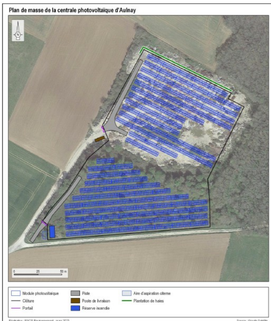
Plan masse du projet – extrait étude d'impact page 221

Les sensibilités écologiques de l'aire d'étude immédiate sont principalement liés à deux mares temporaires situées dans la partie nord (flore sécifique et amphibiens), et aux habitats buissonnants dans la partie sud (avifaune et chiroptères). A l'ouest du projet, hors site d'implantation, les boisements constituent des habitats de transit et de reproduction de nombreux groupes d'espèces. Le projet est localisé à 600 mètres environ à l'ouest du site Natura 2000 "Massif forestier de Chizé-Aulnay" désigné au titre de la Directive "Habitats - faune-flore" 2 présentant un intérêt notamment pour les chiroptères