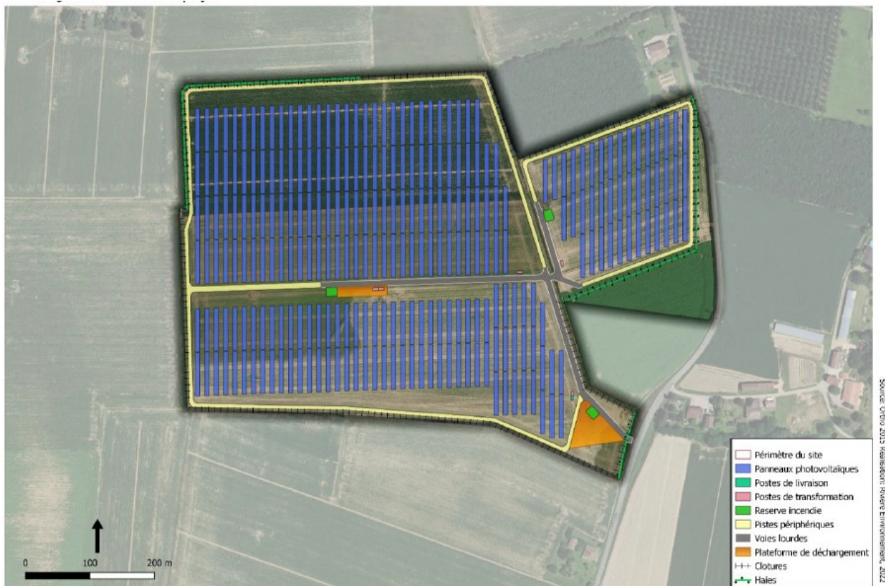
Plan masse du projet – extrait étude d'impact page 6

Le projet prévoit un raccordement électrique via des réseaux enterrés, sur une longueur d'environ 7 400 m, au niveau du poste-source UNET localisé à Clairac (cf. tracé en page 70 de l'étude d'impact).