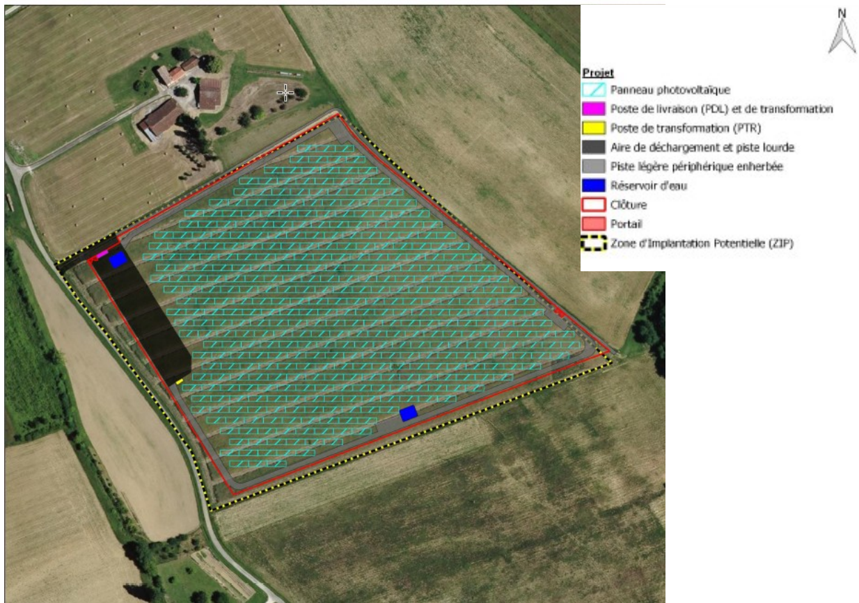
Plan masse du projet – extrait étude d'impact page 209

Le parc solaire sera composé des éléments suivants: