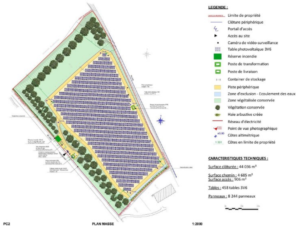
Plan masse du projet – extrait étude d'impact page 40

Le projet prévoit un raccordement électrique au poste source Chéraute Barragary distant d'environ 19 km, en privilégiant un tracé le long des voiries existantes (cf cartographie en page 37 de l'étude d'impact).