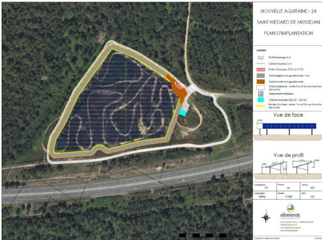
Figure 15 : Schéma d'implantation du projet de la centrale photovoltaïque de Saint-Médard-de-Mussidan

Le plan de masse du projet est présenté ci-dessous.