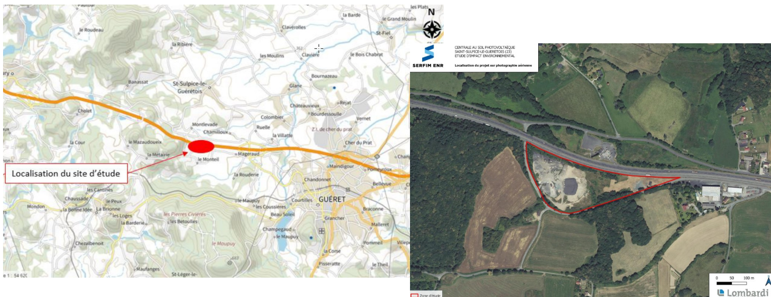
Plan de situation – extrait étude d'impact pages 20 et 22

Le parc s'implante sur une surface clôturée voisine de 4,7 ha et développe une puissance d'environ 4,98 MWc.