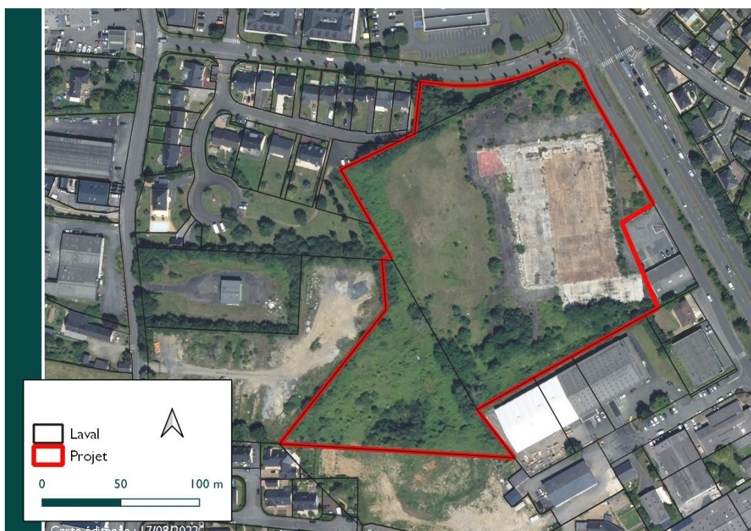
Figure 2: Vue aérienne du site du projet