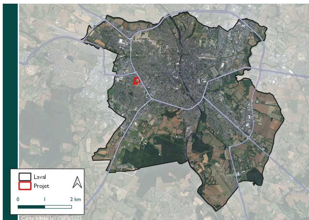
Figure 1: Situation géographique sur le territoire de la commune de Laval

(PC) constituant l'opération (le PC1 porte sur les immeubles A, B, C, D et E et le PC2 porte sur le bâtiment F), une étude d'impact portant sur le périmètre global de cette dernière a été conduite.