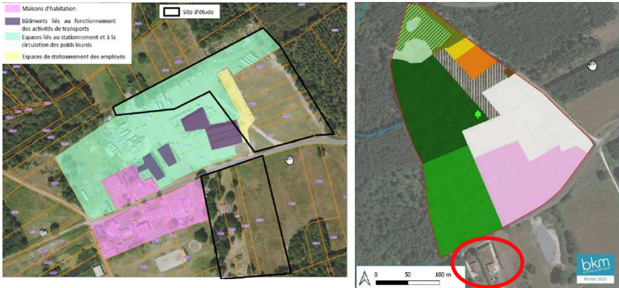
Habitations riveraines des sites de Bertranneau (à gauche) et de la route de la Chaume des Landes (à droite) - source : notice d'évaluation environnementale, pages 32 et 34

Les constructions autorisées sur les sites de Bertranneau et de la route de la Chaume des Landes sont susceptibles d'être à l'origine de nuisances sonores et d'une dégradation de la qualité de l'air pour les habitations riveraines existantes des deux sites.