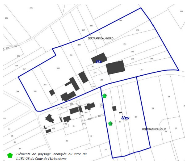
Règlement graphique « Bertranneau » avant (à gauche) et après (à droite) la révision allégée n°1 du PLU (rapport de présentation pages 14 et 16)