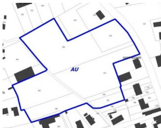
Règlement graphique secteur « La Louvette - secteur nord » avant (à gauche) et après (à droite) la révision allégée n°1 du PLU (rapport de présentation page 8)

L'orientation d'aménagement et de programmation (OAP) de la zone AU intègre déjà les 0,12 hectares supplémentaires ; il s'agit de mettre en cohérence le règlement graphique pour favoriser la création des 16 logements envisagés sur le site.