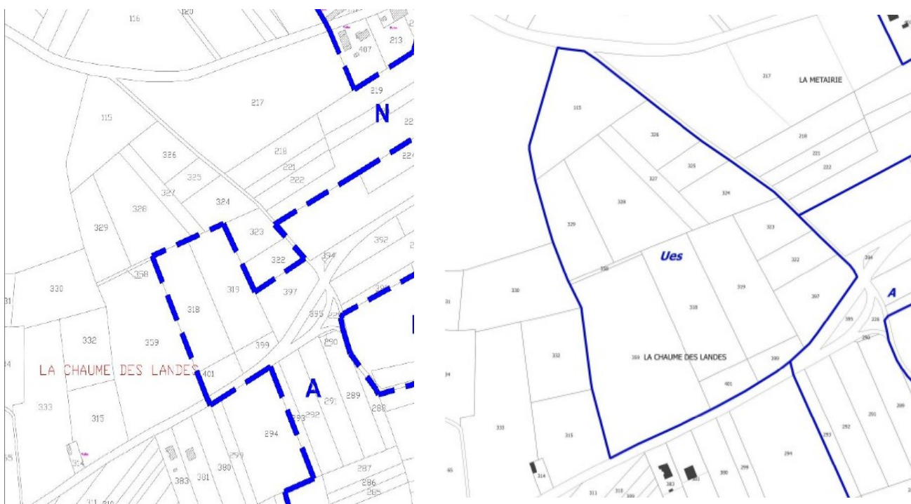
Règlement graphique « Route de la Chaume des Landes » avant (à gauche) et après (à droite) la révision allégée n°1 du PLU (rapport de présentation pages 24 et 27)

Le site est actuellement classé en zones naturelle (N) et agricole (A). La révision allégée n°1 vise à mettre le zonage en cohérence avec l'occupation réelle des sols, en créant un secteur Ues, dédié aux équipements, aux services et aux activités de gestion des déchetteries et de recyclage des matériaux. Elle étend également le secteur Ues par rapport au périmètre de la déchetterie actuelle afin de permettre son extension. Au total, les espaces agricoles et naturels consommés représentent d'après la notice 5,2 hectares.