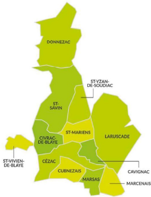
Localisation du territoire de la communauté de communes Latitude Nord Gironde

Le territoire fait partie du périmètre du schéma de cohérence territoriale (SCoT) du Cubzaguais Nord Gironde, en cours d'élaboration à l'échelle des communautés de communes Grand Cubzaguais et Latitude Nord Gironde. Le projet de SCoT arrêté le 4 juillet 2024 a fait l'objet d'un avis 2 de la MRAE le 3 octobre 2024. Le SCoT prévoit notamment une forte hausse de la population (+1,3 % par an) avec un phasage de la consommation foncière.