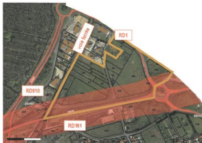
Bande d'inconstructibilité de 75 mètres sur le secteur « Terres des Bordes » (source : étude au titre du L. 111-8 du Code de l'urbanisme : p. 14).

Cette bande impacte fortement la partie sud du site de projet. La collectivité envisage donc de la réduire de 75 à 15 mètres sur le linéaire bordant le site de projet (environ 600 mètres).