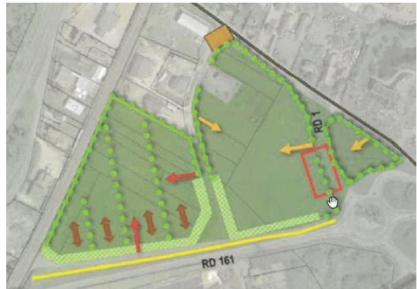
OAP du secteur de « La Terre des Bordes » avant (à gauche) et après (à droite) la révision allégée (source : notice de présentation, pages 15 et 16)

L'extension du périmètre de l'OAP, la modification des règles de hauteur et des règles de clôtures ont vocation à prendre en compte un projet du syndicat Eaux de Vienne – Siveer visant à construire une usine de traitement d'eau potable, en remplacement de l'usine actuellement située dans le centre-ville de Châtellerault 2 . En lien avec ce projet, le dossier mentionne également la transformation d'un forage de reconnaissance existant sur la zone, en forage d'exploitation .