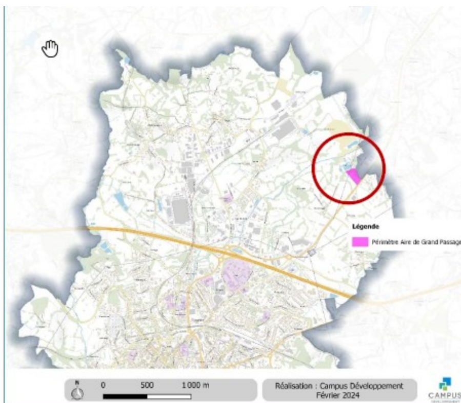
Localisation du site de l'aire de grand passage

Le plan local d'urbanisme de la commune de Guéret a été approuvé le 23 juin 2011. Le dossier précise que la création de cette aire de grand passage est prévue par le schéma départemental d'accueil des gens du voyage approuvé le 10 janvier 2024.