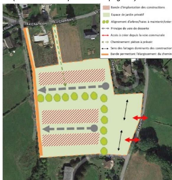
Modification de l'OAP de la zone à urbaniser 1AU à Chambon-sud et création de l'emplacement réservé d'accès en orange (Notice de présentation pages 14 et 15)