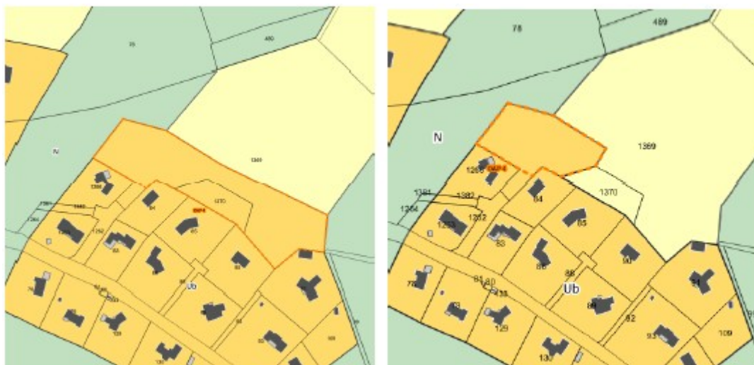
Modification de la zone urbaine Ub aux Huillières